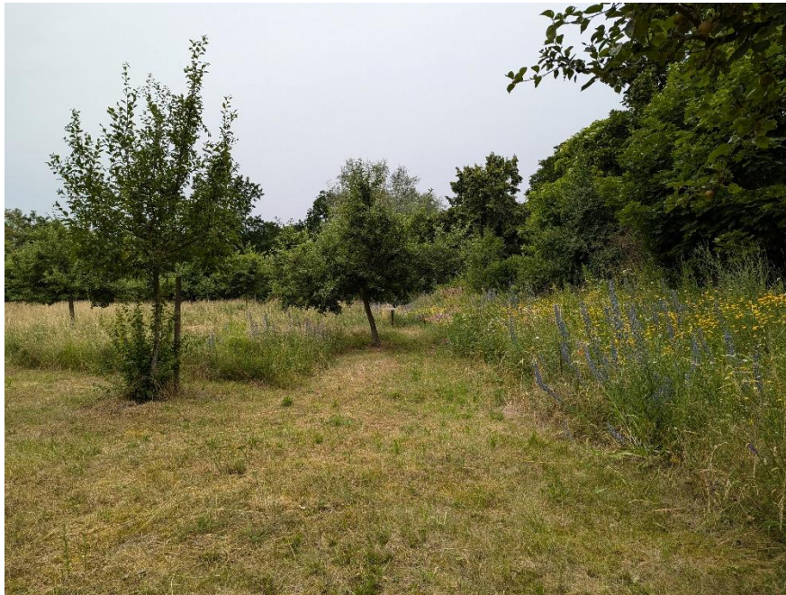
Abbildung 3: Blick auf die Streuobstwiese am Schleipfuhl

Für Marzahn-Hellersdorf bieten Streuobstwiesen wie am Schleipfuhl zudem großes Potenzial als Orte der Umweltbildung. Hier erleben Kinder, Jugendliche und Erwachsene unmittelbar, wie ökologische Zusammenhänge funktionieren. Der Wechsel der Jahreszeiten, die Blüte der Obstbäume, die Entwicklung der Früchte und die Vielfalt der dort lebenden Tiere machen Natur begreifbar. Streuobstwiesen ermöglichen praktische Bildungsangebote zu Themen wie Biodiversität, nachhaltige Landnutzung, Klimaschutz und regionaler Ernährung. Sie schaffen Begegnungsräume zwischen Mensch und Natur und fördern das Verständnis für die Bedeutung intakter Ökosysteme. Der Schutz und die Entwicklung von Streuobstwiesen sind daher eine Gemeinschaftsaufgabe. Naturschutzverbände, Politik, Verwaltung, Bildungseinrichtungen und engagierte Bürgerinnen und Bürger können gemeinsam dazu beitragen, bestehende Flächen zu sichern, neue Obstbäume zu pflanzen und das Bewusstsein für ihren Wert zu stärken. Jede erhaltene Streuobstwiese ist ein Gewinn für Natur, Klima und Lebensqualität.