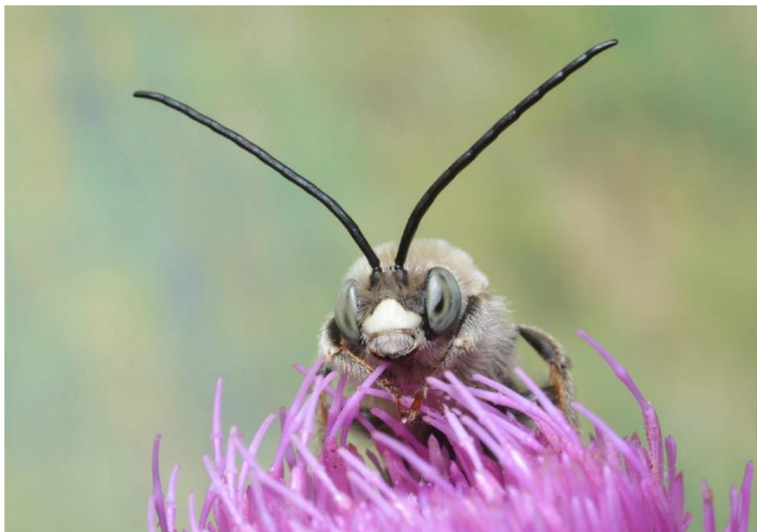
Abbildung2: Männchen der Flockenblumen-Langhornbiene Tetralonia dentata

Wildbienenarten auf jeder der Flächen festgestellt. Bereits 3 Jahre nach Maßnahmenbeginn zur Förderung von Wildbienen auf ausgewählten öffentlichen Grün- und Freiflächen im Bezirk Marzahn-Hellersdorf, konnten 26 Berliner Rote Listen-Arten, die als mehr oder weniger stark gefährdet gelten, in diesen Gebieten nachgewiesen werden. Insgesamt fanden die Bienenexpert:innen 143 Wildbienenarten in den Untersuchungsgebieten. Darunter waren auch 26 anspruchsvolle Pollenspezialisten. Hervorzuheben ist insbesondere der Fund der Flockenblumen-Langhornbiene ( Tetralonia dentata ), welche nur noch in Berlin, Brandenburg und Sachsen-Anhalt vorkommt und in Berlin vom Aussterben bedroht ist. Sie sammelt Pollen nur an Flockenblumen und Disteln.