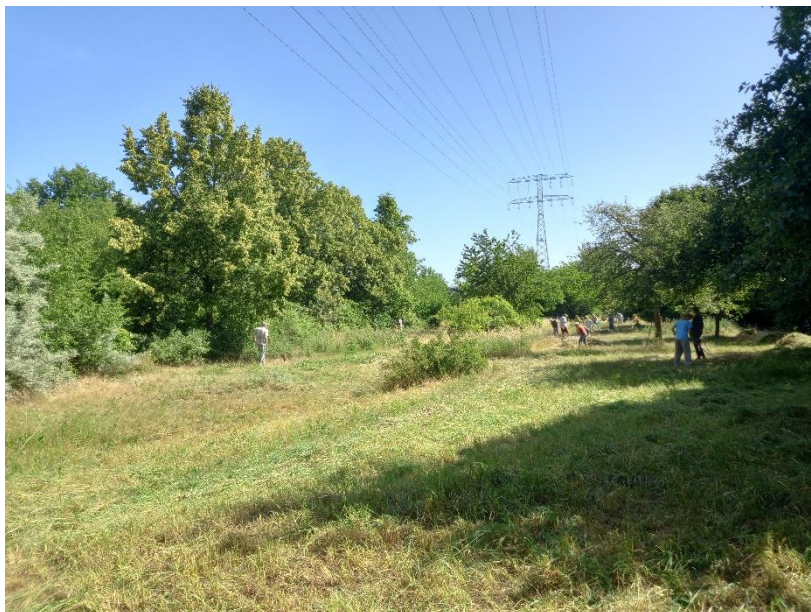
Abbildung1: Sensenmahd auf einer Grünfläche am der Jenaer Straße nahe Schleipfuhl

Auf den Grünflächen um den Schleipfuhl wird dann auch bei der Johannimahd tatsächlich nicht einfach der Rasenmäher angeworfen, sondern die Sense geschwungen. Was auf den ersten Blick wie eine traditionelle Arbeitstechnik erscheint, ist in Wirklichkeit ein modernes Instrument des Natur- und Klimaschutzes. Die Sensenmahd verbindet den Schutz von Pflanzen und Tieren mit einer nachhaltigen Pflege von Grünflächen und schafft gleichzeitig wertvolle Möglichkeiten für Umweltbildung und bürgerschaftliches Engagement. In einer Zeit, in der der Rückgang vieler Insekten-, Vogel- und Pflanzenarten zu den größten Herausforderungen des Naturschutzes zählt, gewinnen schonende Bewirtschaftungsformen zunehmend an Bedeutung.